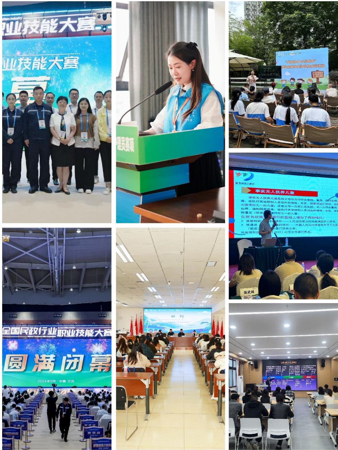
图 2 专业教师参与“岗课互融”