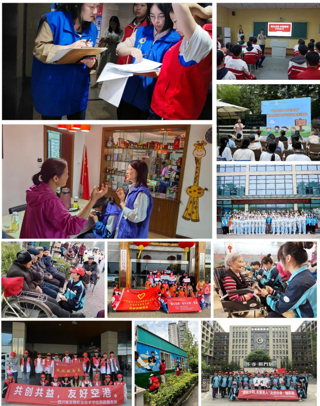
图 5 师生参与社会服务