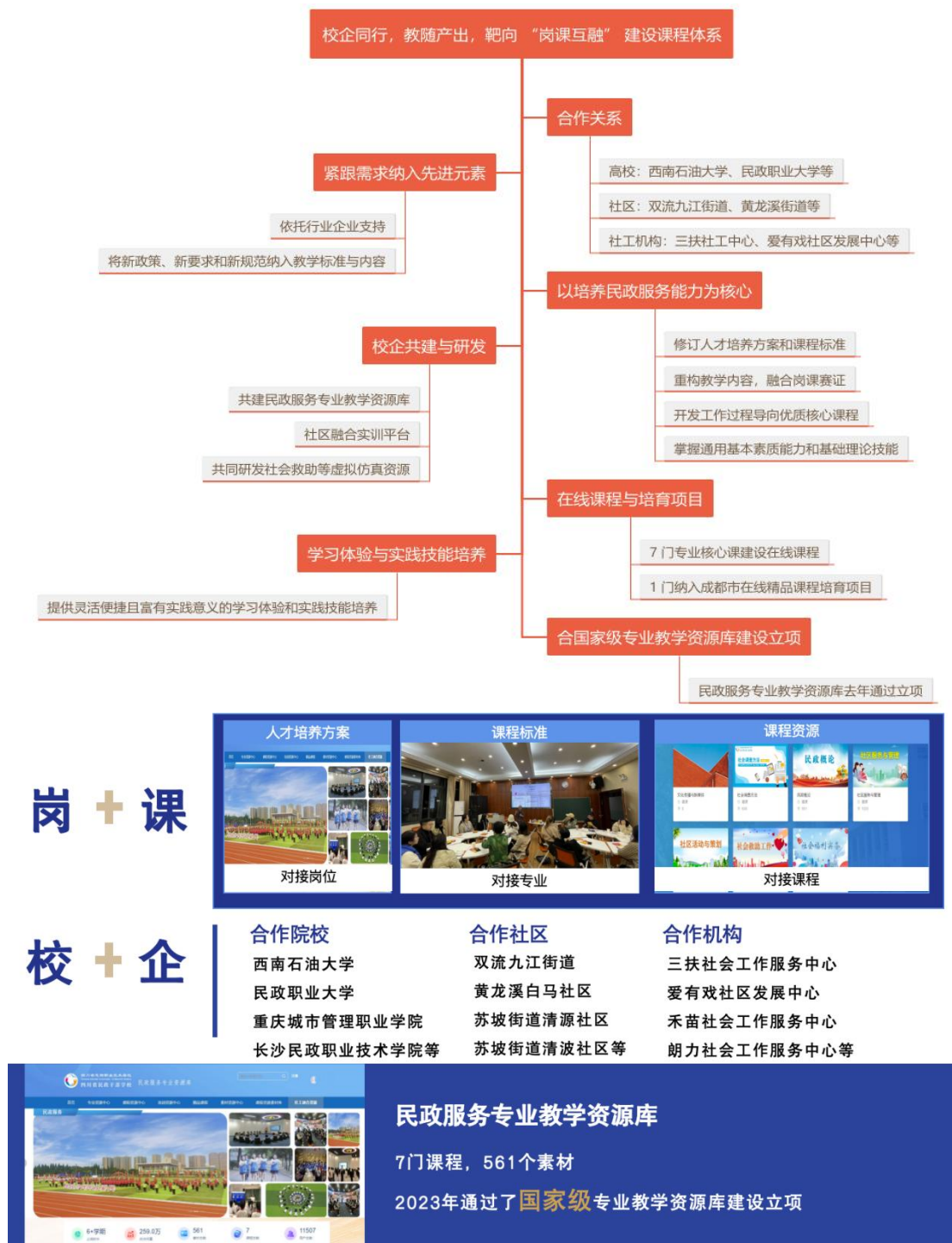
图1 校企同行，教随产出，靶向“岗课互融”建设课程体系

已纳入成都市在线精品课程培育项目。为学生提供了更加灵活、便捷且富有实践意义的学习体验和实践能力培养。其中，民政服务专业教学资源库，去年通过了国家级专业教学资源库建设立项。