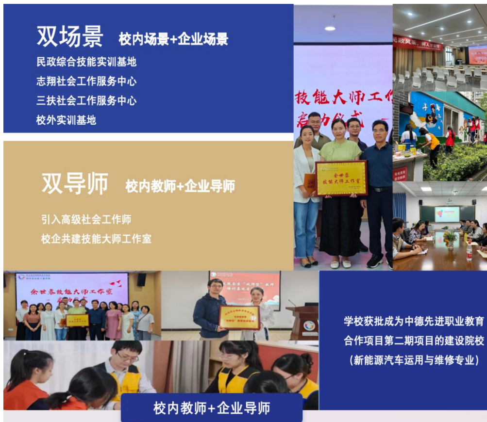
图3 项目引领，实体运作，搭建“双元协同”合作育人平台